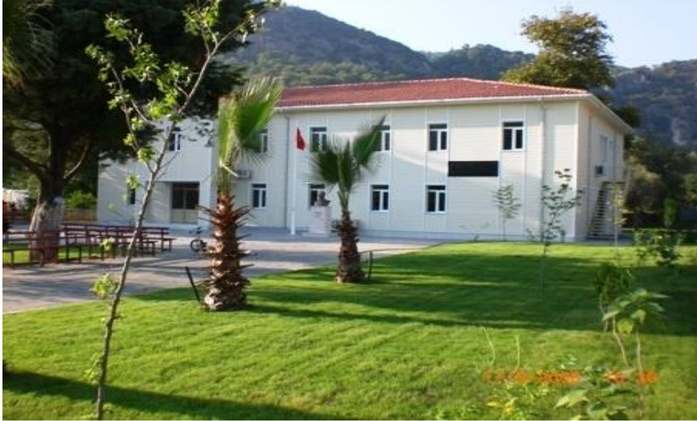
İNİÇE AHMET NAZİF ZORLU İLKOKULU / ORTAOKULU